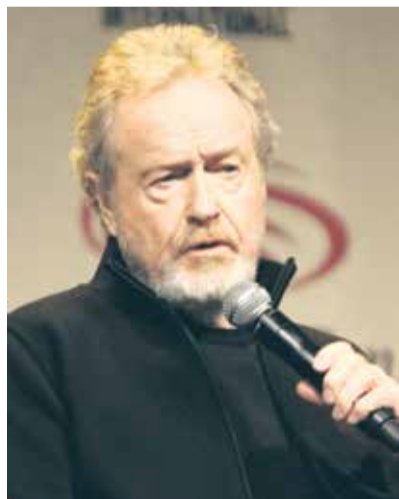
Ridley Scott

Rodney v knjigi opozarja, da moramo kolonializem videti kot le en delček mnogo širšega pojava imperializma, ki se razteza po vsem svetu in ki v svoje okrilje zaobjema vse kapitalistične države. Njen izid na slovenskem trgu v letu 2021 izdajo tako umešča ob bok mnogim družboslovnim monografijam, ki pomagajo kontekstualizirati umeščenost podrejenih držav - ne nazadnje tudi naše - v razmerje do svetovnih gospodarskih in političnih centrov.