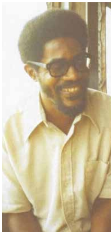
Walter Rodney

Vendar pa se je Evropa s prehodom v kapitalizem hitro znašla velik razvojni korak pred Afriko, in ko so raziskovalne odprave prepoznale obilje tamkajšnjih naravnih virov ter navajenost prebivalstva na trdo delo, se je začel mučen proces zasuznjenja dobrnega dela afriške celine. Rodney tu nima nikakršnega dvoma: vzhajajoči kapitalizem je bil tisti, ki je pogнал v gibanje trgovino s sužnji. Medtem ko je v zahodnem svetu gospodarski razvoj spremljala hitra rast prebivalstva, je Afrika ostala brez milijonov svojih fizično najposobnejših ljudi, ki so s prisilnim delom podpirali rast v tujih deželah. Čeprav je kolonializem, striktno gledano, v večini držav trajal komaj 70 let, pa je bilo ravno to obdobje ključno za nepopravljivo povečanje razvojne razpoke med Evropo in Afriko. Skupaj z vsemi trajnimi posledica-